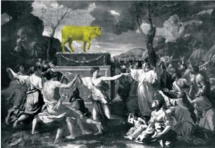
Nicolas Poussin - Der Tanz um das goldene Kalb, 1635

Wirtschaftskrise, Jobkrise, Lebenskrise: Der widerwärtige, menschenverachtende Tanz ums Goldene Kalb ist mit einem globalen Krach beendet worden.